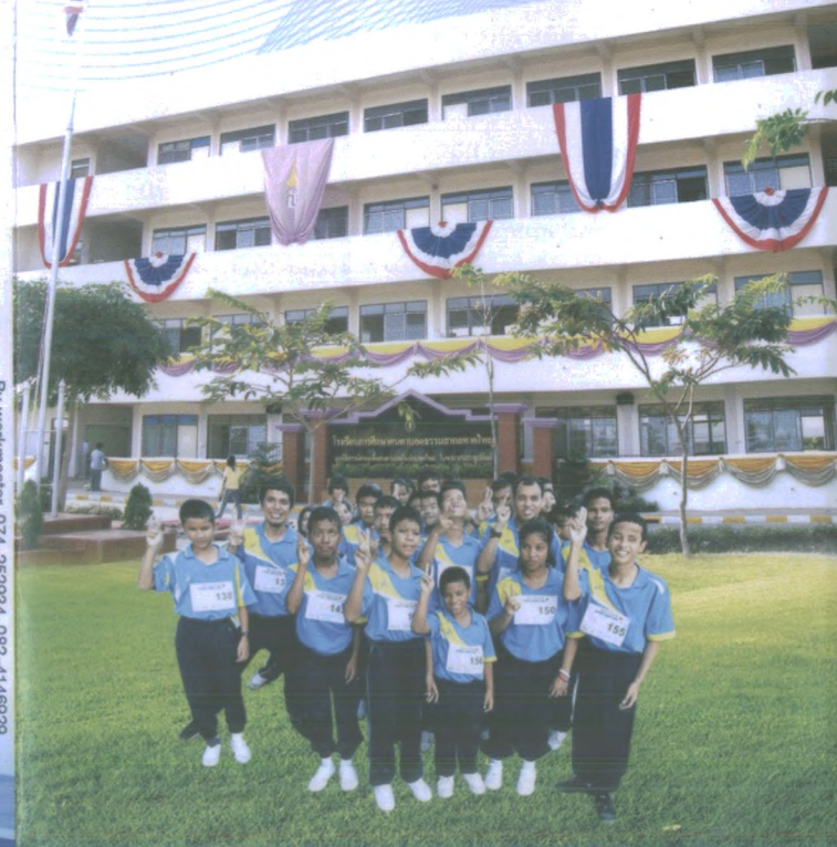
By Workmaster: 074-252934, 082-4146929

การให้ที่ยิ่งใหญ่ คือ การให้โอกาสที่สามารถเปลี่ยนแปลงชีวิตของคนได้ Great giving is giving chance to be able to change people's live